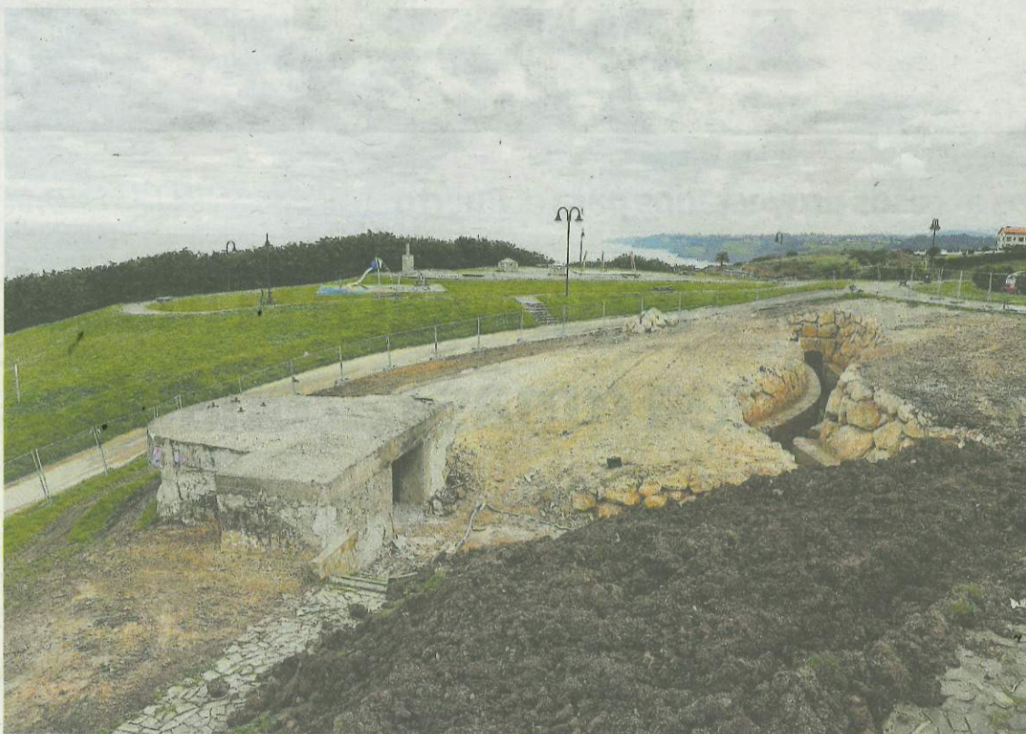
Vista del puesto de tiro (a la izquierda) de La Providencia y el tramo de trinchera más próximo al mirador, con el muro en escollera ya instalado.

El puesto de tiro de La Providencia, elemento clave de la batería defensiva instalada en el entorno a inicios del siglo XX, llevaba décadas descontextualizada. Se conectaba con el mirador por un camino empedrado que ni siquiera replicaba el trazado original y que ya ha sido derribado. La actuación central del proyecto de recuperación, por tanto, era eliminar este sendero, sin valor histórico alguno, y recrear la vieja trinchera, que de acuerdo a los planos históricos que se conservan se sabía que seguía un trazado en «zigzag» y que unía este elemento con la batería de repuesto, una casamata situada cerca del parque infantil. En esta